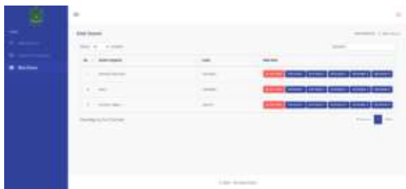
Gambar 19. Halaman Nilai Siswa