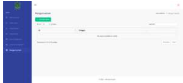
Gambar 16. Halaman Pengumuman

Pada halaman ini menampilkan pengumuman yang sudah di input ke dalam sistem terdiri dari tabel ID, tanggal, dan search untuk melakukan pencarian.