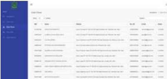
Gambar 28. Halaman Laporan Data Siswa

Pada halaman ini menampilkan data laporan siswa yang diberikan kepada kepala sekolah, terdiri dari tabel NIS, nama, alamat, no.hp, email, kelas.