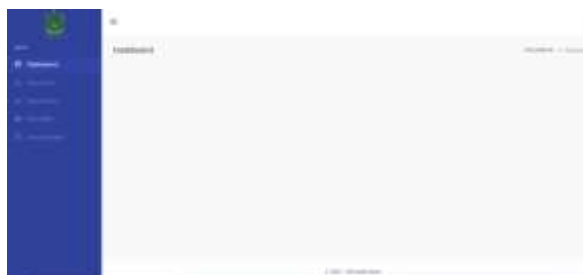
Gambar 26. Halaman Dashboard Kepala Sekolah

Pada halaman ini menampilkan dashboard yang diakses oleh user kepala sekolah