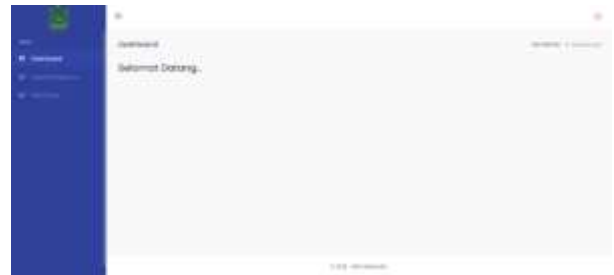
Gambar 17. Halaman Dashboard Guru

Pada halaman ini menampilkan dashboard yang di akses oleh guru.