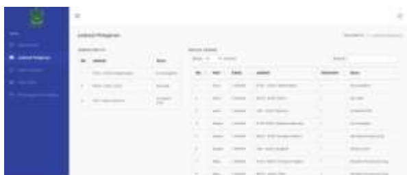
Gambar 21. Halaman Jadwal Pelajaran Siswa

Pada halaman ini menampilkan jadwal ajaran yang di terima siswa, terdiri dari tabel mer, hari, kelas, jadwal, semester, dan nama guru.