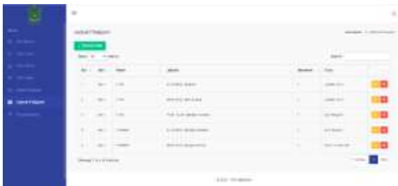
Gambar 14. Halaman Jadwal Pelajaran

Pada halaman ini menampilkan data mata pelajaran yang terdiri dari tabel ID, nama mata pelajaran, jenjang, dan button untuk edit dan hapus.