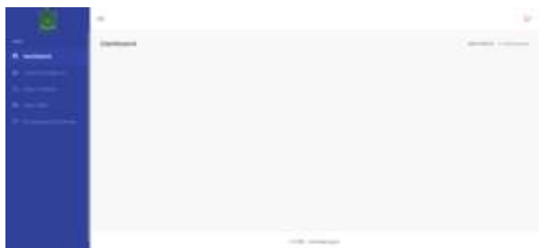
Gambar 20. Halaman Dashboard Siswa