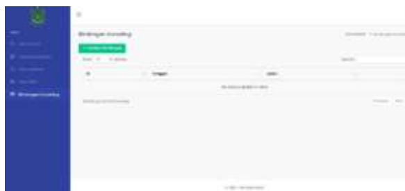
Gambar 25. Halaman Bimbingan Konseling Siswa

Pada halaman ini menampilkan bimbingan konseling yang bisa di akses user siswa, terdiri dari tabel ID, tanggal, dan judul bimbingan.