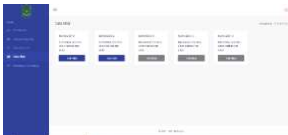
Gambar 23. Halaman Data Nilai Siswa

Pada halaman ini menampilkan data nilai siswa setiap semester.