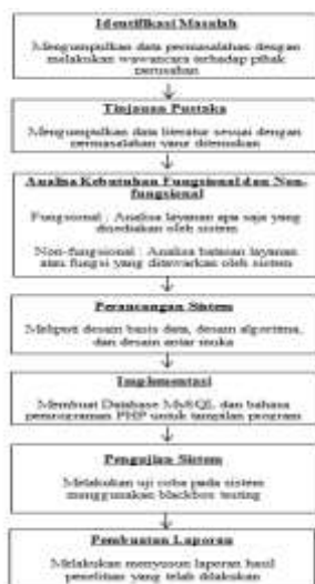
Gambar 1. Diagram Alur Penelitian

Referensi ini dicari dari buku atau jurnal. Hasil dari pencarian ini yaitu terkumpulnya beberapa teori yang sesuai, sehingga tujuan selanjutnya adalah memperkuat rumusan masalah sebagai dasar.