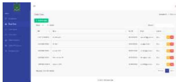
Gambar 11. Halaman Data Guru