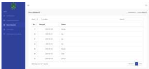
Gambar 22. Halaman Data Absensi Siswa

Pada halaman ini menampilkan data absensi yang di tampilkan kepada siswa, terdiri dari tabel nomer, tanggal, dan status absensi.