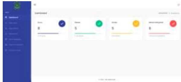
Gambar 10. Halaman Dashboard Admin

Pada halaman ini menampilkan data guru yang terdiri dari tabel NIP, nama, no HP, email, jabatan dan terdapat button tambah, edit, dan hapus untuk memperbarui data.