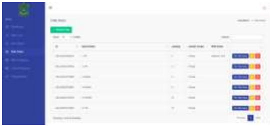
Gambar 12. Halaman Data Kelas