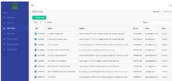
Gambar 13. Halaman Data Siswa

Halaman ini menampilkan data siswa terdiri tabel NIS, nama siswa, alamat, no.hp, email, dan kelas.