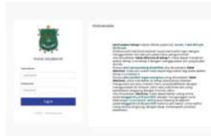
Gambar 9. Halaman Login

Pada tampilan ini, semua pengguna yang akan mengakses sistem ini harus memasukan username dan password agar dapat masuk ke dalam sistem.