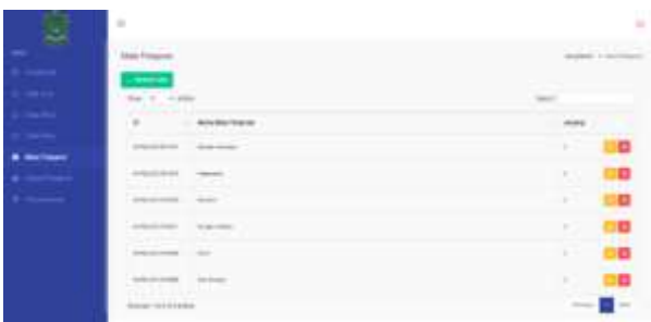
Gambar 15. Halaman Mata Pelajaran