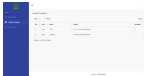
Gambar 18. Halaman Jadwal Pelajaran Guru

Pada halaman ini menampilkan dashboard yang bisa di akses oleh user siswa.