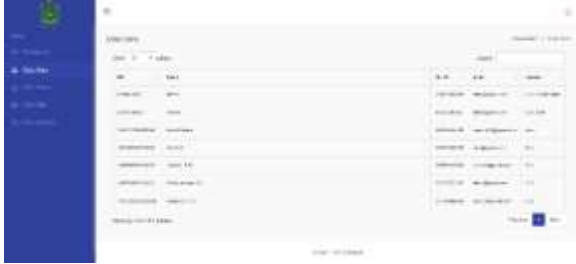
Gambar 27. Halaman Laporan Data Guru

Pada halaman ini menampilkan data laporan guru yang diberikan kepada kepala sekolah, terdiri dari tabel NIP, nama, no.hp, email, dan jabatan.